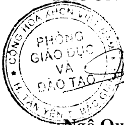
Ngô Quốc Hưng